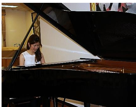
リハーサル風景。 迫力のある演奏が5階まで響きます♪