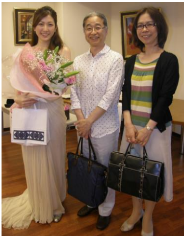
東京混声合唱団のメンバーと 一緒に。