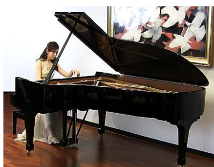
息をつく間もなく繰り返される ショパンエチュードの世界。