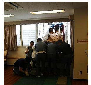
6階の窓から搬入中!